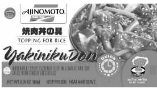
蔬菜、蒜、酱油辣味烧肉

美国味之素冷冻食品公司(Ajinomoto Frozen Foods USA) 是日本 Ajinomoto 的子公司,生产高质量食品已近一个世纪。Ajinomoto 冷冻食品坚持采用安全无虞的原物料,生产过程到制成成品遵循严格食品安全的准则,且不断的致力于研发、改进质量与成品全面的安全控制。